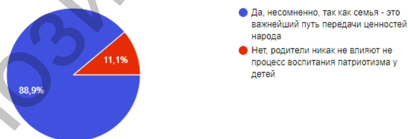
Рисунок 2 – Влияние личности родителей в формировании патриотизма и любви к Родине у подростков

Очень важно также осознавать, что Родина – часть человечества, и гордость за Родину означает и то, что она – уникальная часть человечества (в мировом сообществе необходимо видеть ресурс развития Родины) – данная позиция – позиция известнейшего философа и социолога Э. Фромма [Цит. по: 2, с. 31].