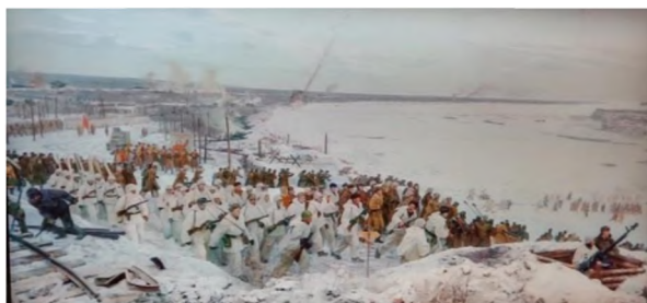
Рис 1. Фрагмент диорамы Прорыв Блокады Ленинграда – дань станковому искусству тех лет.

планом и осветительной партитурой работы свето-техников [3]. Первая в СНГ в период нового времени крупномасштабная панорама была открыта в г. Кировске Ленинградской области под названием «Прорыв» в январе 2018 года. Поэтому музей оборудовали в пандусах моста через Неву (небывалый эксперимент по тем временам)» [4, С. 40].