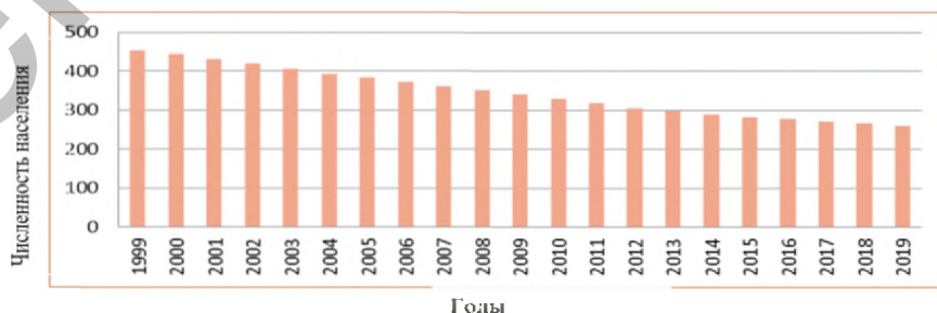
Рисунок 1 – Численность сельского населения Витебской области, 1999–2019гг., (сост. по [1])

Результаты и их обсуждение. В структуре населения 2019 г. доля сельского населения Витебской области составляла 22%, а на долю области в общереспубликанском показателе приходится всего 12,7%. Численность сельского населения области постоянно снижается: с 482,9 тыс. чел. в 1999 г. до 259,9 чел. в 2019 г. (рисунок 1).