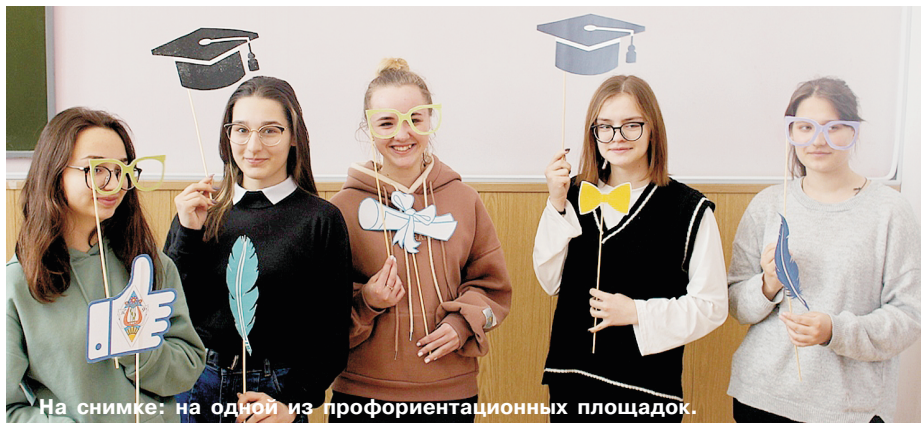
На снимке: на одной из профориентационных площадок.

Кроме этого, в это же время в малом спортивном зале команды студентов раз-