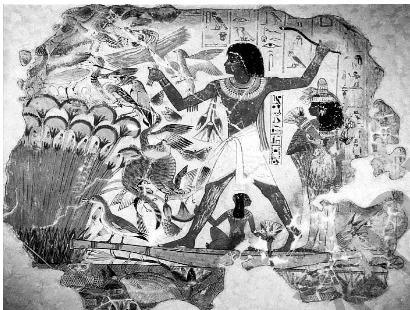
Рисунок 3. Охота на водяных птиц

Заключение. Подводя итоги нашего исследования, следует отметить, что предложенный нами метод обучения рисунку будет весьма полезным на современном этапе обучения основам изобразительной грамоты, так как является малозатратным, с ясной постановкой целей и задач, которые в свою очередь помогают студентам при рисовании фигуры человека.