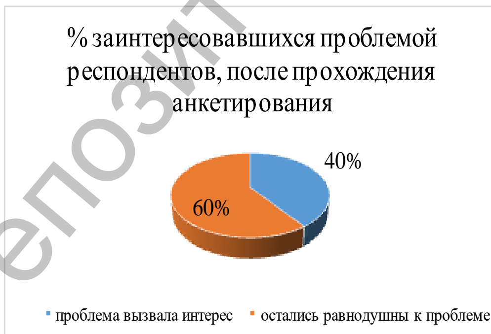
Рисунок 2 – Оценка заинтересованности проблемой

У 57% опрошенных наблюдается присутствие эмоциональной поддержки со стороны родителей, респонденты ощущают себя в семье нужными и любимыми, по отношению к ним предъявляются адекватные требования в соответствии с их возможностями и возрастом. 10% подростков осведомлены о мерах, принимаемых в нашем государстве по предотвращению и защите от насилия. Несколько респондентов сошлись во мнении, отвечая на открытый вопрос о мерах предотвращения эмоционального насилия, что родитель должен устанавливать с ребёнком доверительные отношения, открыто обсуждать волнующие его вопросы, уделять время. А также выяснилось, что 40% участников опроса заинтересовались данной проблемой в ходе исследования (рис.2).