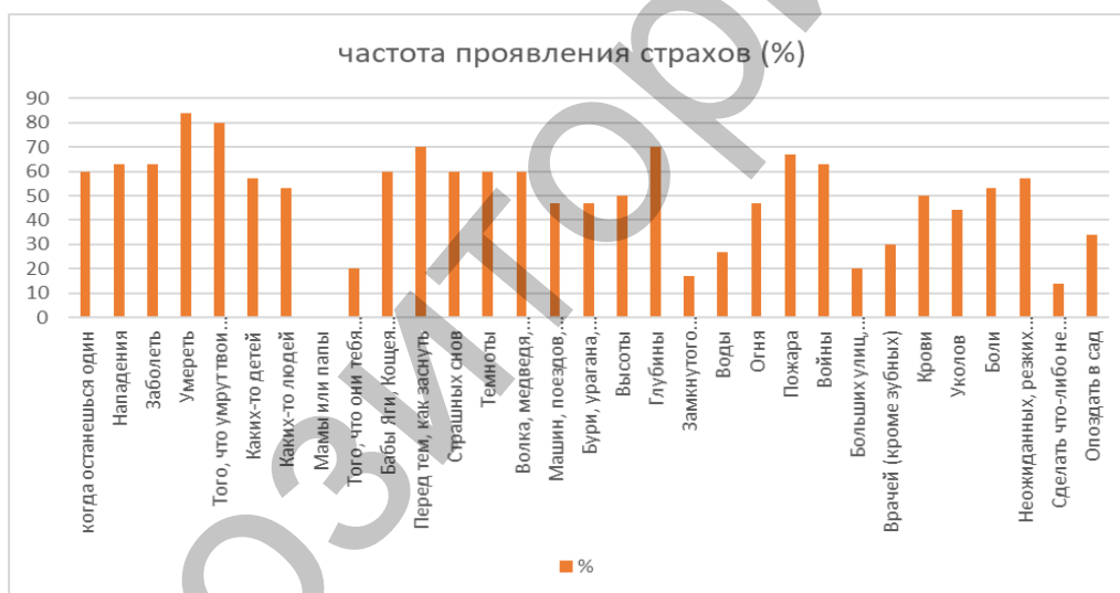
Рисунок 1 – Частота проявления страхов

Результаты и их обсуждение. Анализ результатов, полученных по методике «Страхи в домиках» (А.И. Захаров и М. Панфилова) позволил нам выявить частоту проявления страхов у детей. Данный этап работы представлен нами на рисунке 1.