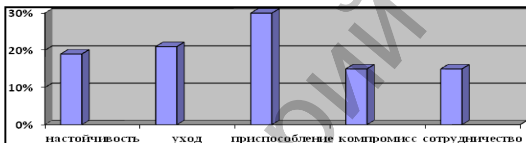
Рисунок 1 – Сведения о стиле разрешения конфликта юношей по методике Дж. Г. Скотта «Оценка уровня конфликтности и стратегий поведения в конфликте»

Результаты и их обсуждения. На основании результатов исследования по методике Дж. Г. Скотта «Оценка уровня конфликтности и стратегий поведения в конфликте» мы выявили, что стили разрешения конфликта у юношей и у девушек отличаются по процентной градации. Так, представим стили разрешения конфликтов у юношей на рисунке 1.