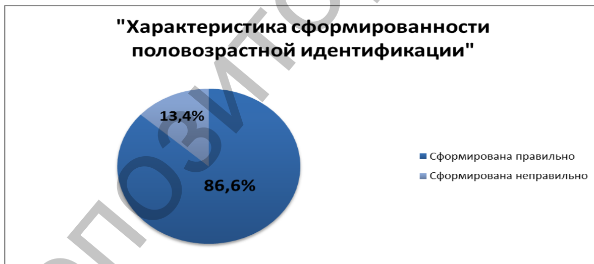
Рисунок 1 – Характеристика сформированности половозрастной идентификации

Результаты и их обсуждение. Полученные результаты представлены на диаграммах (рисунки 1, 2, 3). Анализ полученных результатов по изучению половозрастной идентификации показал, что большая часть детей в количестве 13 человек, что составляет 86,6% от общего числа детей, адекватно идентифицируют себя в настоящем, прошлом и будущем. Соответственно остальные дети, 2 человека, что составляет 13,4%, не смогли идентифицировать себя в настоящем и будущем. Также 9 детей, что составляет 60% от общего числа, правильно смогли составить половозрастную последовательность взросления человека. Остальные 40% выполнить поставленные задачи не смогли.