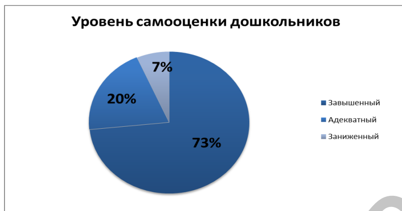
Рисунок 2 – Уровень самооценки дошкольников. Методика «Лесенка»

Анализ полученных результатов по исследованию уровня самооценки дошкольников показал, что большая часть детей, в количестве 9 человек, что составляет 60% от общего числа детей, показали очень высокий уровень самооценки. Четверо детей, что составляет 27% от общего числа, продемонстрировали высокий уровень самооценки. Двое детей, что составляет 13% от общего числа, показали средний уровень самооценки. Низкий и очень низкий уровни диагностированы не были.