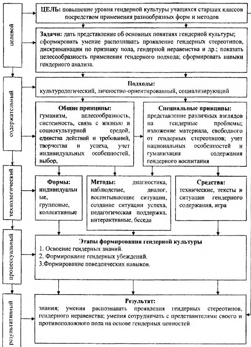
Рисунок 1 – Модель формирования гендерной культуры учащихся старших классов