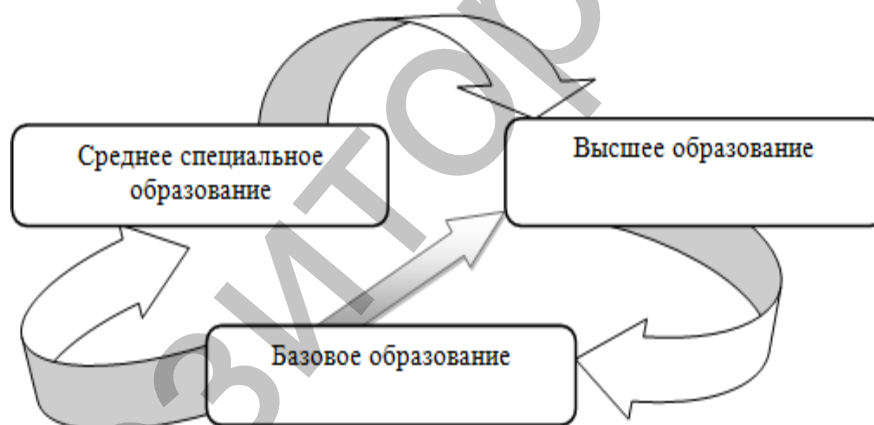
Рис. 2. Система музыкально-педагогического образования

Таким образом, можно утверждать, что кластерная система предполагает цикличность в образовательном процессе. Исходя из вышеизложенного, можно говорить о циклической системе музыкально-педагогического образования (рис. 2).