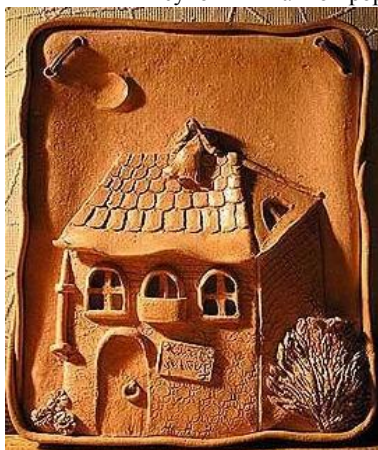
Рисунок 3 – Панно объемное