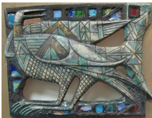
Рисунок 1 – Панно прорезное