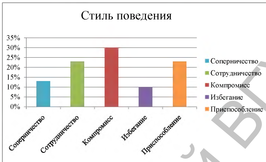
Рисунок 2 – Стиль поведения