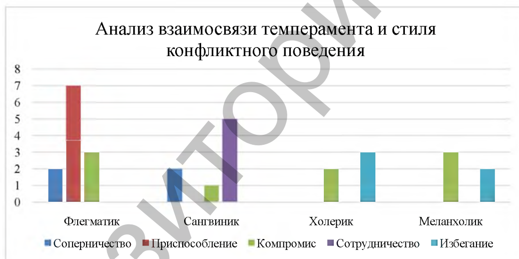
Рисунок 3 – Анализ взаимосвязи темперамента и стиля конфликтного поведения

Заключение. Согласно данным можно сделать вывод о том, что у флегматиков в конфликтных ситуациях преобладает приспособленческий тип поведения. У сангвиников в конфликтных ситуациях преобладает модель сотрудничества. У исследуемых холериков в конфликтных ситуациях наблюдается модель поведения соперничество. Исходя из полученных данных видно, что у меланхоликов преобладает модель поведения – избегание.