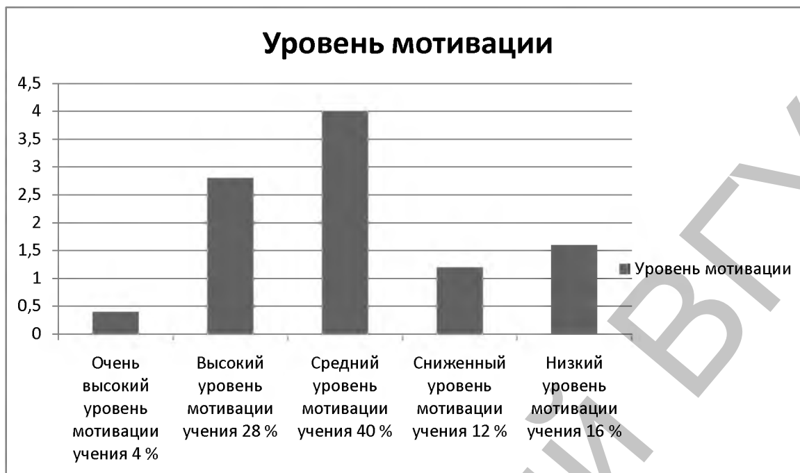
Рисунок 2 – Сумма баллов итогового уровня мотивации учения

На основе полученных данных можно сделать вывод о том, что учащиеся имеют высокую внутреннюю учебную мотивацию, с интересом подходят к изучению предметов, не боятся трудностей, в основном проявляют активность и заинтересованность. Уровень мотивации в классе, находится на достаточно хорошем уровне. Наблюдается ценность знаний, интерес и самостоятельность. Способность к целеполаганию сформирована на не достаточном уровне.