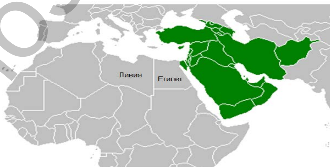
Рисунок – Страны Западной и Юго-Западной Азии, Ливия и Египет

Результаты и их обсуждение. В соответствии с вариантом туристического районирования мира ЮНВТО, Израиль, Турция и Кипр – Восточное Средиземноморье, относятся к Европейскому макрорегиону. Но учитывая специфику развития туризма, обосновано сравнивать Израиль с соседями по географическому региону. Это страны Ближневосточного макрорегиона по ЮНВТО – страны Западной и Юго-Западной Азии, Египет и Ливия (рисунок).