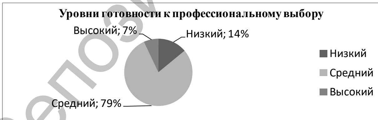
Рисунок 2 – Уровни готовности учащихся 9 «Б» класса к профессиональному выбору

В результате применения опросника «Готовность подростков к выбору профессии» (В.Б. Успенский) в группе учащихся 9 «Б» класса были получены следующие результаты, представленные на рисунке 2.