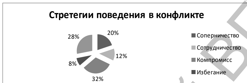
Рисунок 2 – Результаты диагностики стратегий поведения в конфликте

В ходе проведения методики К. Томаса «Стратегии поведения в конфликте» были получены результаты, представленные на рисунке 2: