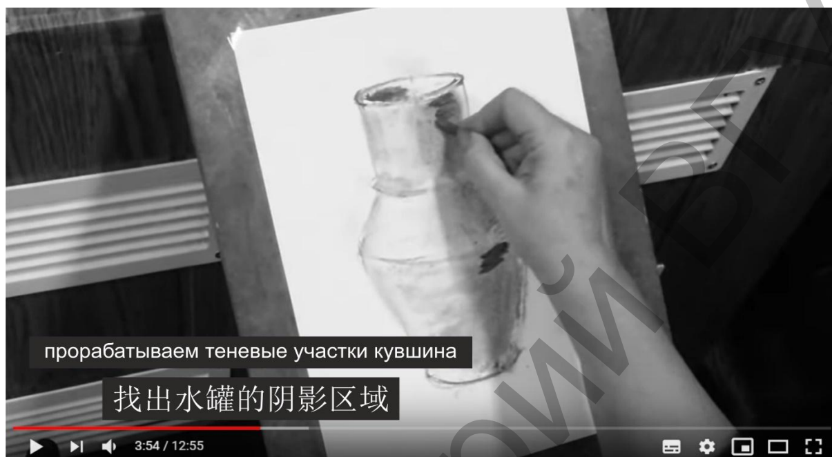
Рисунок 2. Фрагмент мастер-класса «Обучение рисованию предметов быта»

ных студентов сертификационным требованиям, низкой мотивацией к изучению русского языка в связи с другим направлением профессиональной деятельности, целесообразнее применение демонстрации презентации на мультимедийном оборудовании, где видеоряд будет сопровождаться субтитрами на русском и китайском языках (рисунок 2)