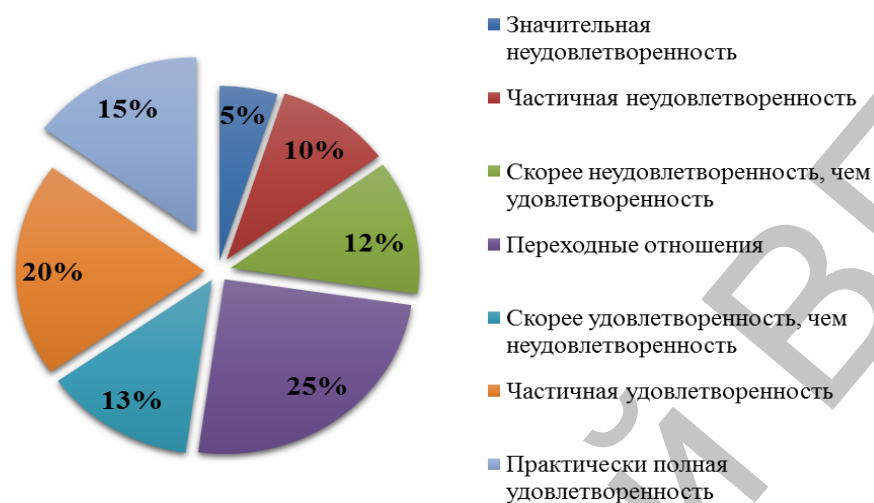
Рисунок 1 – Степень удовлетворенности браком испытуемых пар.

ных, то есть не удовлетворены браком – 40%. Опрошенные мужчины живут в скорее благополучных и благополучных семьях, то есть, удовлетворены браком 52%; живут в переходных, скорее неблагоприятных, неблагоприятных семьях, то есть не удовлетворены браком – 48%.