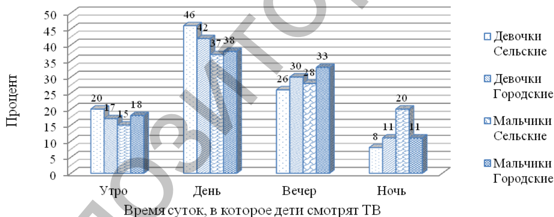
Рисунок 1 – Реальное время телесмотрения детей 7–10 лет в зависимости от времени суток

Результаты и их обсуждение. В результате исследования мы выявили, что сельские мальчики 9 лет проявляют высокий интерес к ночному ТВ (20%), в отличие от девочек и от городских детей, чье любопытство к нему чуть ниже. На рисунке 1 мы попытались отразить полученное реальное время телесмотрения детей в зависимости от времени суток.