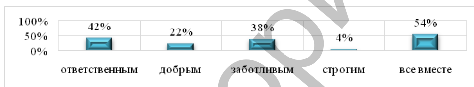
Рисунок 2 – Какими должны быть родители

Родители должны быть ответственными, так считают 42% молодых людей, заботливыми – 38%, добрыми – 22%, строгими – 2%, все вместе – 54% (см. рис. 2).