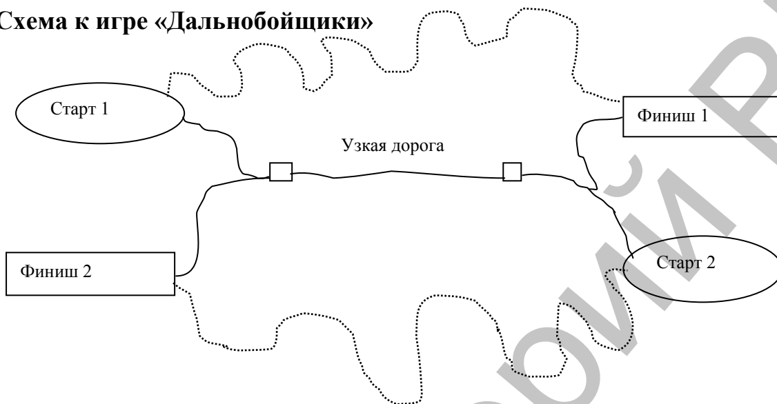
Схема к игре «Дальнобойщики»