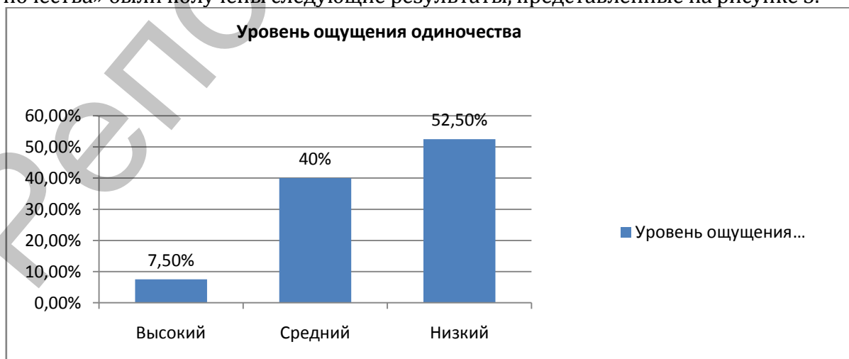
Рисунок 3 – Уровень ощущения одиночества

В результате применения методики «Методика субъективного ощущения одиночества» были получены следующие результаты, представленные на рисунке 3.