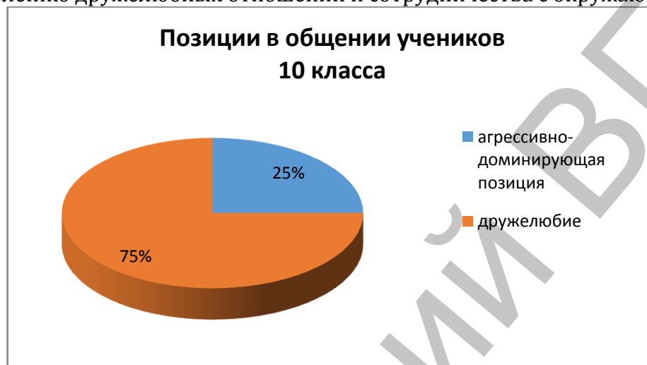
Рисунок 4 – Позиции в общении учеников 10 класса

Что касается учеников 10 класса, то по результатам повторной диагностики опросника Т. Лири «Методика диагностики межличностных отношений» мы выяснили, 5 человек, что составляет 25% от общего количества учеников в классе, преобладает агрессивно-доминирующая позиция в общении. Данная позиция препятствует сотрудничеству и успешной совместной деятельности. У оставшихся 15 респондентов, что составляет 75% от общего количества учеников в классе, преобладает такая позиция в общении как дружелюбие, такие личности стремятся к установлению дружелюбных отношений и сотрудничества с окружающими.