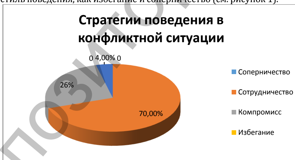
Рисунок 1 – Стратегии поведения в конфликтной ситуации 9 класса

В классе 19 учащихся, у тринадцати из них, что составляет 70% от общего количества учащихся в классе преобладает в конфликтной ситуации такой вид поведения, как сотрудничество, у пятерых (26%) – компромисс, у одного (4%) участника преобладает приспособление и не у одного человека в данном классе не был выявлен такой стиль поведения, как избегание и соперничество (см. рисунок 1).