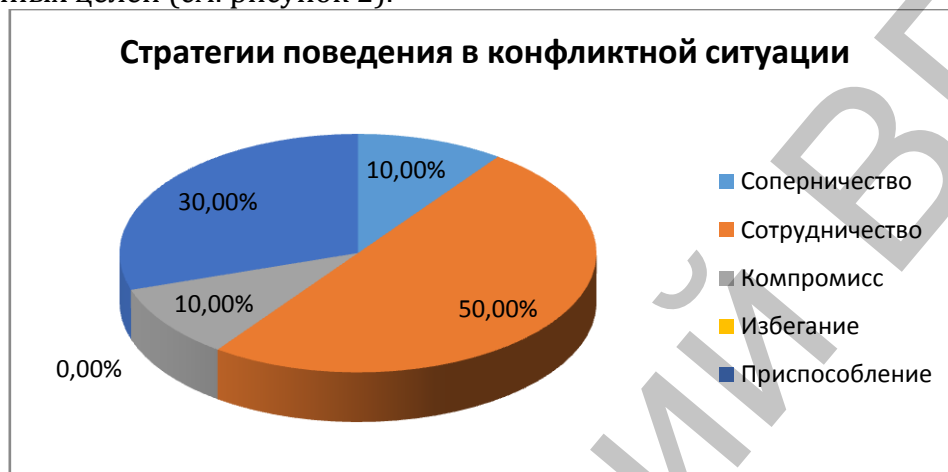
Рисунок 2 – Стратегии поведения в конфликтной ситуации учеников 10 класса

ведущим является такой вид поведения в конфликтной ситуации, как компромисс, что означает приход к альтернативе, полностью удовлетворяющий интересы обеих сторон. В 10 классе у двух ученика, что составляет 10% от общего количества учащихся в классе, в конфликтной ситуации преобладает такой стиль поведения, как соперничество, что означает стремление добиться удовлетворения своих интересов в ущерб другому. В данном классе отсутствует такой стиль поведения в конфликтной ситуации как избегание, для которого характерно как отсутствие стремления к кооперации, так и отсутствие тенденции к достижению собственных целей (см. рисунок 2).