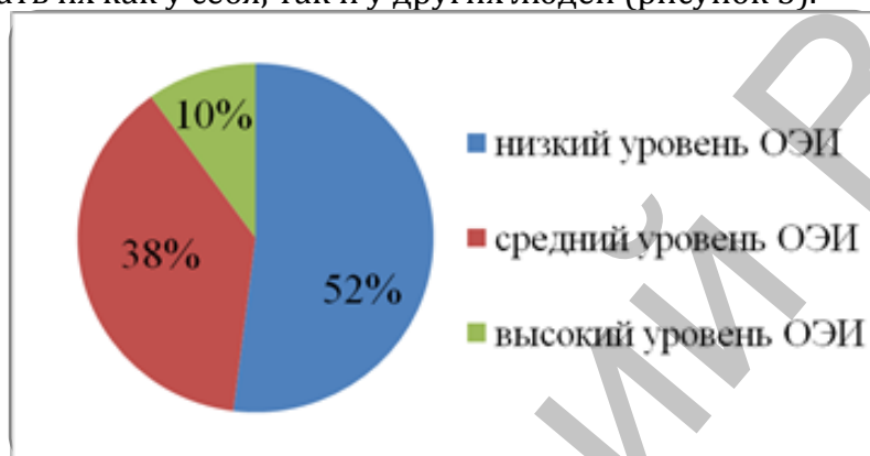
Рисунок 3 – Соотношение уровней общего эмоционального интеллекта у студентов 1-го курса

Анализ результатов эмоционального интеллекта показал, что у большинства студентов 1-го курса наблюдается низкий уровень эмоционального интеллекта (52%). Это может означать то, что на данном этапе изучения психологии первокурсники не владеют знаниями и умениями, которые могут им помочь в идентификации своих и чужих эмоций. Средний уровень у 38% респондентов, и это указывает на то, что они имеют достаточный уровень эмоционального интеллекта для того, чтобы комфортно чувствовать себя в коллективе, способны на среднем уровне понимать свои и чужие эмоции. Высокий уровень общего эмоционального интеллекта показали только 10% испытуемых. Их можно охарактеризовать как очень эмпатийных людей, которые могут с легкостью управлять своими эмоциями и распознавать их как у себя, так и у других людей (рисунок 3).