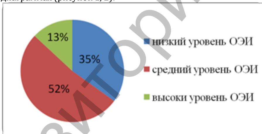
Рисунок 1 – Процентное соотношение уровней общего эмоционального интеллекта у студентов 4-го курса

Результаты и их обсуждение. По итогам исследования уровня эмоционального интеллекта и толерантности к неопределенности мы получили самое большое количество испытуемых с высокими данными показателями у студентов 4-го курса. Это объясняется возможной аккумуляцией знаний, умений и навыков в сфере эмоциональности, полученных в период обучения и уже начавшейся у многих профессиональной деятельностью. Полученные результаты наглядно представлены на диаграммах (рисунок 1, 2):