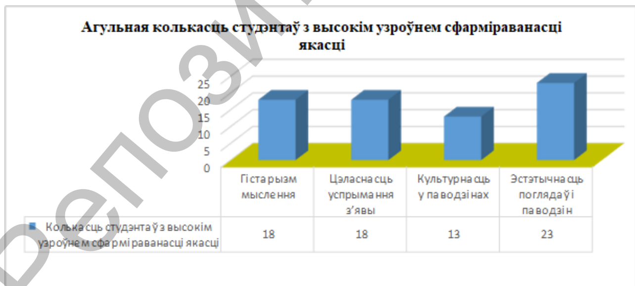
Мал. 2. Агульная колькасць студэнтаў з высокім узроўнем развіцця якасцей