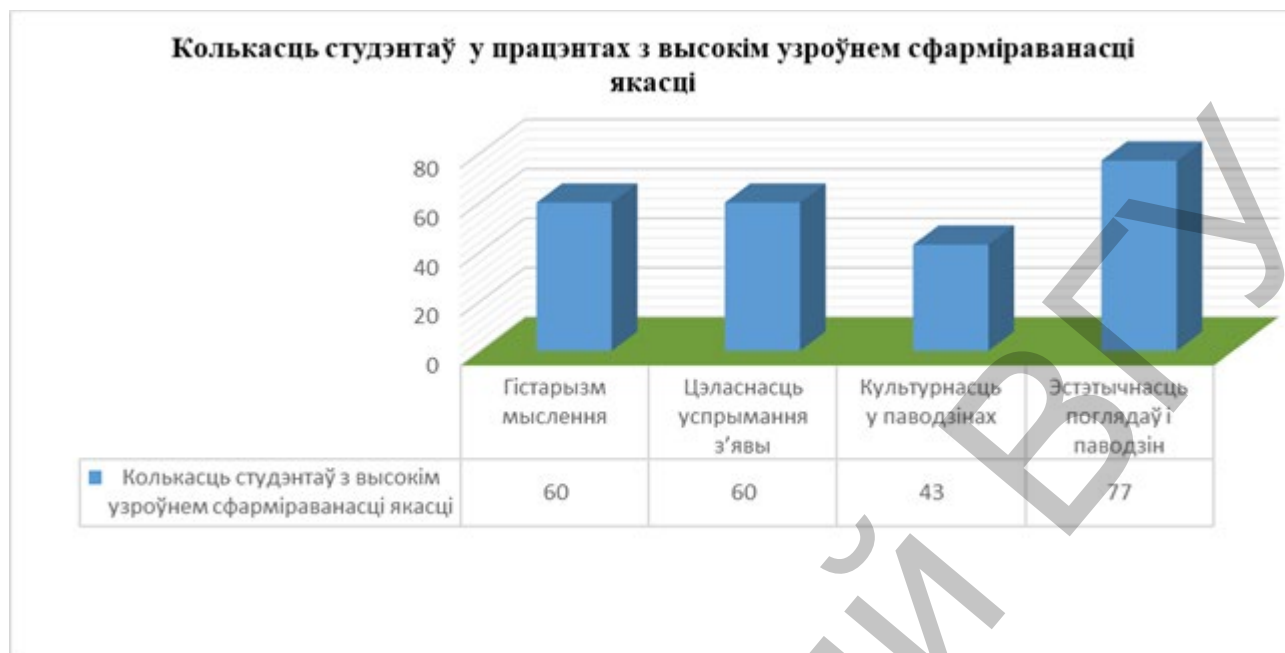
Мал. 3. Агульная колькасць студэнтаў з высокім узроўнем развіцця якасцей у працэнтных суадносінах

Заклучэнне. Як паказаў праведзены эксперымент, колькасць студэнтаў з высокім узроўнем развіцця якасцей павялічылася. Гэта дае падставу сцвярджаць, што створаная адукацыйная прастора ўніверсітэта і музея пры падрыхтоўцы педагогаў-лагапедаў забяспечвае комплекснае фарміраванне такіх якасцей, як гістарызм мыслення, цэласнасць успрымання з'явы, культурнасць у паводзінах, эстэтычнасць поглядаў і перакананняў, што дае падставу гаварыць аб якаснай прафесійнай падрыхтоўцы будучага спецыяліста ў галіне педагогікі на аснове сфарміраванасці прафесійных кампетэнцый. Створаная прастора “ВНУ–музей” дазваляе ажыццяўляць асобнае фарміраванне будучага педагога як гуманнага і дасведчанага ўдзельніка адукацыйнага працэсу, бо дапамагае развіць інтэлектуальныя здольнасці; узбагачае яго ведамі ў розных галінах навукі; уплывае на выхаванне агульнай культуры, эстэтычнага густу, на фарміраванне здольнасці да самааналізу; фарміруе актыўную жыццёвую пазіцыю дзякуючы шырокаму кругагляду і цэласнаму бачанню карціны свету; садзейнічае пераасэнсаванню свайго ўласнага жыцця. Усё адзначанае вышэй дае падставу сцвярджаць, што працэс прафесійнай падрыхтоўкі педагогаў-лагапедаў будзе арганізаваны пры гэтым больш якасна, чым пры традыцыйным выкладанні дысцыплін, таму што закранаецца тады светапоглядная і каштоўнасная сфера асобы, што забяспечвае трываласць засвоеных ведаў і яе развіццё.