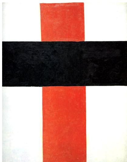
Рис. 1 К. Малевич Супрематическая живопись 1920 г.