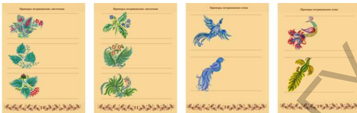
Рис. 7 Сложные (составные) элементы росписи

– знакомство с композиционными схемами и составление симметричных композиций (рис. 8);