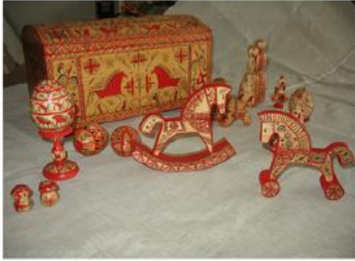
Рис. 1 Исаева А. Набор игрушек, мезенская роспись