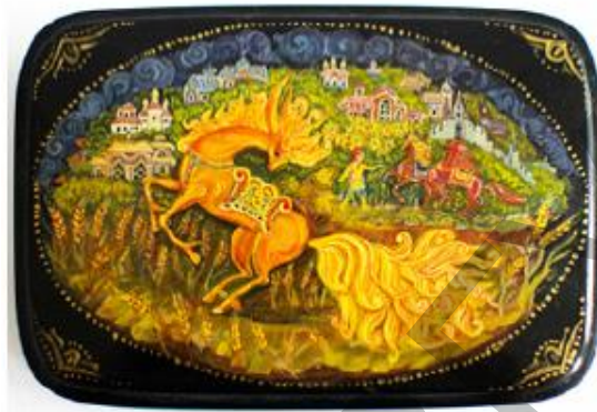
Рис. 2 Шитова А. Шкатулка, палехская роспись