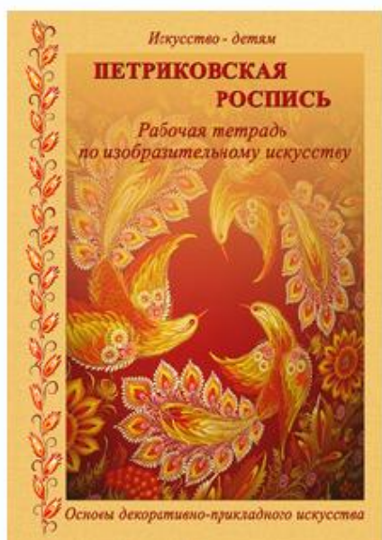
Рис. 4 Рабочая тетрадь