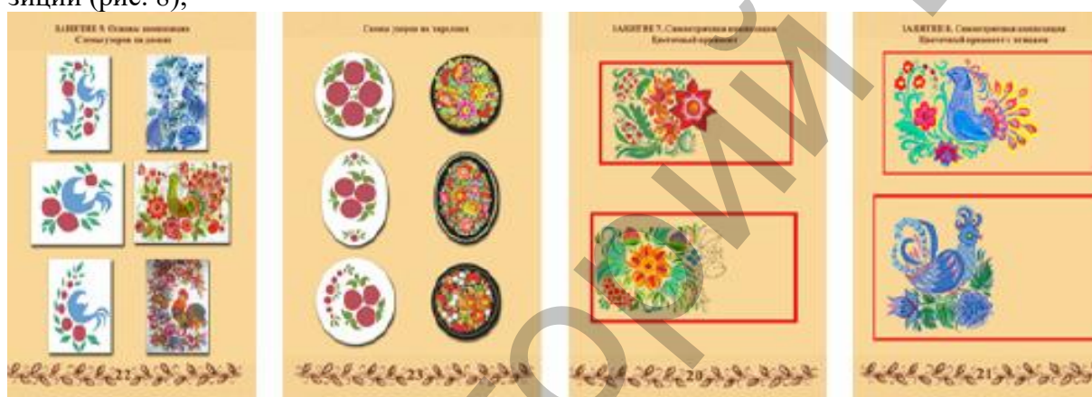
Рис. 8 Композиционные схемы и симметричные композиции

– знакомство с композиционными схемами и составление симметричных композиций (рис. 8);