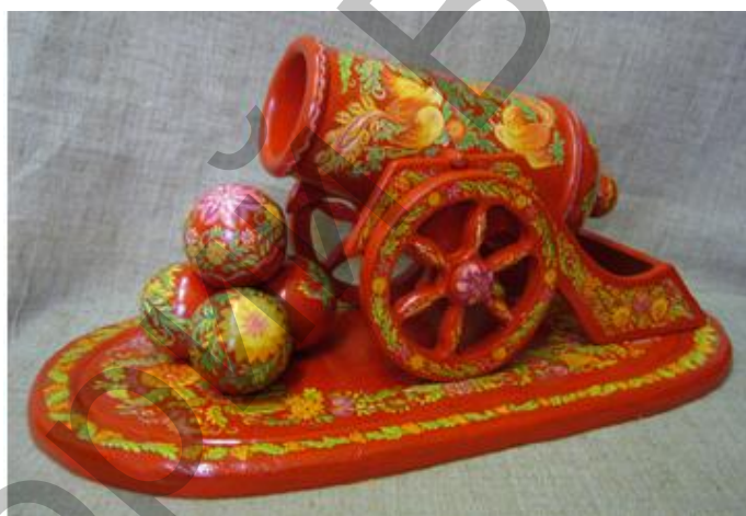
Рис. 5 Сувенирная пушка

Рабочая тетрадь для учащихся предусматривает последовательное, структурированное и лаконичное изложение материала, сопровождающегося богатым иллюстративным рядом, а также систему учебно-творческих заданий, направленных на формирование умений и навыков: