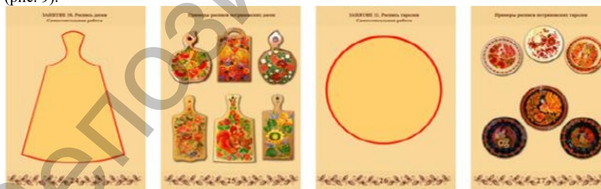
Рис. 9 Примеры заданий для самостоятельной разработки композиций

– составление самостоятельных композиций по мотивам петриковской росписи (рис. 9).