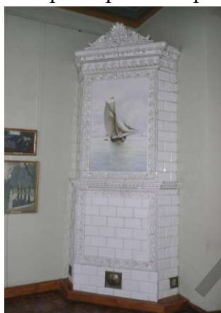
Рис. 9 Изразцовая печь. Особняк Ф. Ефремова. Чебоксары