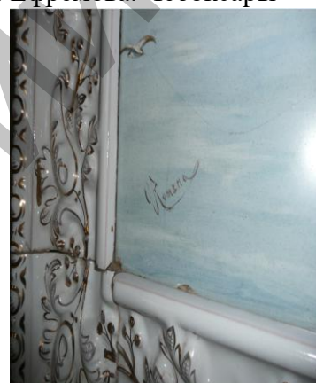
Рис. 10 Изразцовая печь. Особняк Ф. Ефремова. Чебоксары. Фрагмент декора