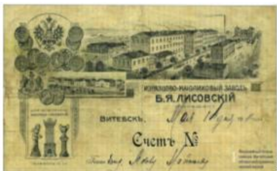
Рис. 1 Фирменный бланк завода Б.Я. Лисовского 1911 года