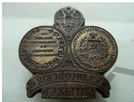
Рис. 2 Клише завода Б.Я. Лисовского