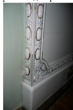
Рис. 12 Фрагмент декора печи в парадном помещении. Особняк Ф. Ефремова. Чебоксары

В целом, печи и камин, облицованные изразцами завода Б.Я. Лисовского из Витебска «немногословны», они сдержаны в декоре, строгие по форме и являются историко-культурным наследием народа Беларуси.