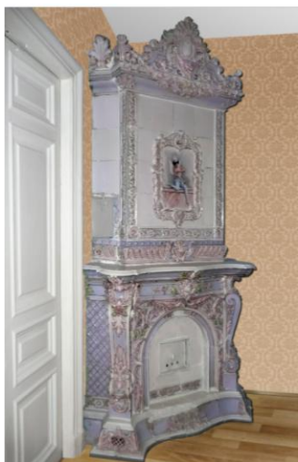
Рис. 3 Изразцовая печь б. доходном доме Э.Г. Шведерского