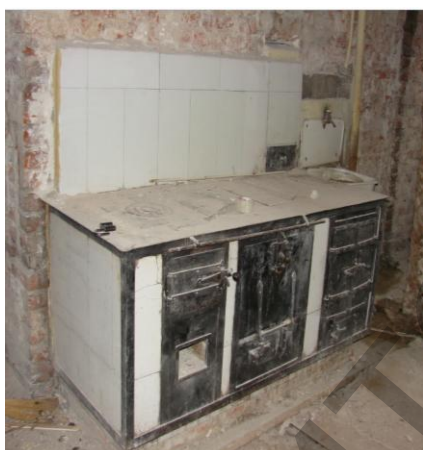
Рис. 5 Кухонная варочная печь. Санкт-Петербург. Облицовка завода Б.Я. Лисовского.