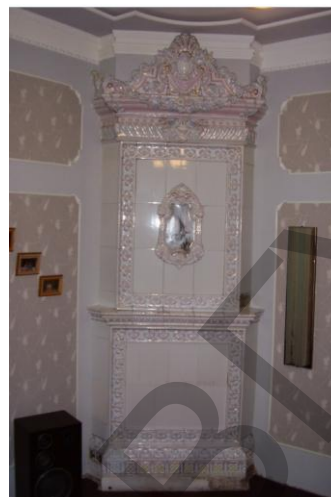
Рис. 4 Изразцовая печь в антикварном магазине «Лаба Ярославна»