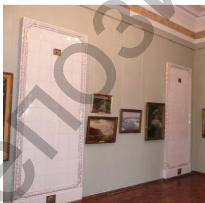
Рис. 11 Две стеновые печи в парадном помещении. Особняк Ф. Ефремова. Чебоксары