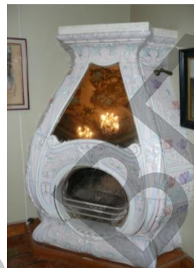
Рис. 8 Изразцовый камин. Особняк Ф. Ефремова. Чебоксары