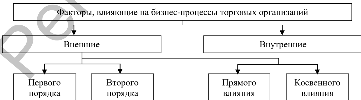
Рисунок 1 – Факторы, влияющие на бизнес-процессы торговых организаций

При этом в состав внутренних были включены факторы, возникающие непосредственно в рамках течения процессов в организации. Такие факторы зависят от внутреннего строения бизнес-процессов и взаимодействия их структурных элементов и могут корректироваться. В целом внутренние факторы организаций торговли представлены следующими категориями: характер оказываемых услуг (тип торговой организации), масштаб организации и ее структура, степень автоматизации и технического обеспечения, обеспеченность основными ресурсами и т.д.