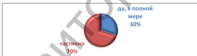
Рисунок 3 – Удовлетворенность матерей оказанием психолого-педагогической помощи детям с особенностями развития

Необходимую психолого-педагогическую помощь родители получают также, по их мнению, частично (70%). В необходимом объеме получают психолого-педагогическую помощь 30% родителей (Рисунок 3). Все родители указали, что получают психолого-педагогическую помощь только на базе «ЦКРОиР г. Горки».