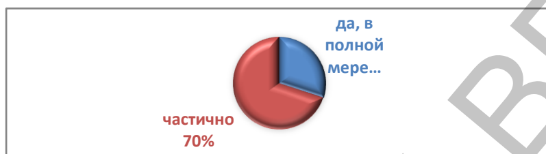
Рисунок 2 – Удовлетворенность матерей оказанием медицинской помощи детям с особенностями развития

Большинство матерей считает, что их ребенок получает необходимую медицинскую помощь лишь частично (70%). Только 30% респондентов считают, что получают необходимую медицинскую помощь в полной мере (медицинское обслуживание детей осуществляется отделением поликлиники учреждения здравоохранения «Горецкая центральная районная больница») (Рисунок 2).