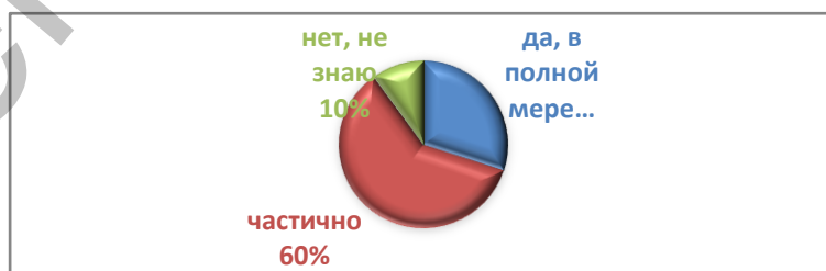
Рисунок 1 – Осведомленность матерей о правах ребенка с ОПФР и его семьи

Респонденты указали, что права детей с особенностями психофизического развития и их родителей в основном знают частично (60%). В полной мере знакомы с правами детей с ОПФР и их родителей только 30% опрошенных. В то же время 10% родителей не знакомы с правами детей и родителей (Рисунок 1). Среди документов, в которых закреплены права детей с особенностями психофизического развития, родители назвали Закон Республики Беларусь «О правах ребенка», а также Кодекс Республики Беларуси об образовании. Это свидетельствует о недостаточной правовой грамотности родителей в данной области.