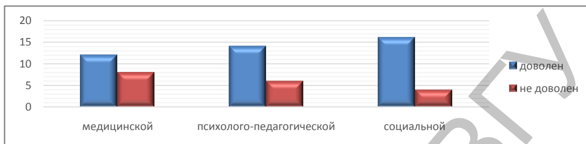
Рисунок 5 – Удовлетворенность матерей качеством предоставляемой детям с особенностями развития различными видами помощи

В целом родители, воспитывающие детей с ОПФР, довольны качеством оказания различных видов получаемой помощи (Рисунок 5). Однако часть респондентов отмечает необходимость повышения качества предоставляемой медицинской, социальной, психолого-педагогической помощи, что свидетельствует о наличии определенных проблем в семье.