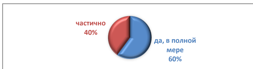
Рисунок 4 – Удовлетворенность матерей, воспитывающих детей с особенностями развития, предоставляемой социальной помощью

Необходимую социальную помощь родители детей с ОПФР получают как на базе «ЦКРОиР г. Горки», так и на базе учреждения «Горецкий районный центр социального обслуживания населения». Большинство матерей считают, что получают социальную помощь в полном объеме (Рисунок 4).