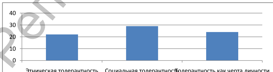
Рисунок 2 – Средние значения по шкалам «Индекса толерантности»

Средние значения по шкалам качественной оценки были следующими: этническая толерантность – 22 из 32 баллов, социальная толерантность – 29 из 37 баллов, толерантность как черта личности – 24 из 32 баллов (рисунок 2).