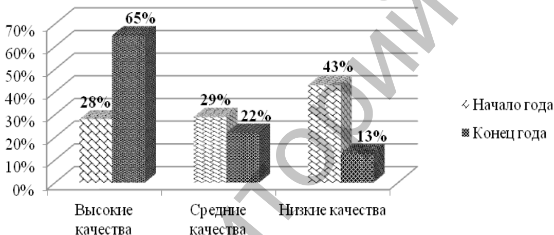
Диаграмма 3 – Сравнение уровней сформированности патриотических качеств экспериментальной группы на начало и конец учебного года

Общий вывод таков, что проделанная работа по Программе оказалась эффективной и дала хорошие результаты, что позволяет рекомендовать данную методику другим преподавателям системы профессионального образования [1–9].