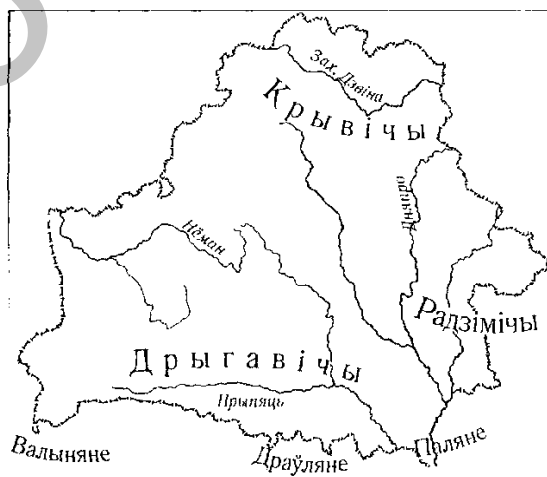
Рис. 2. Места расселения древних племен на территории Беларуси

Показ мест расселения древних племен на территории Беларуси выявил значительные затруднения у старшеклассников с интеллектуальной недостаточностью, что может быть связано с недостаточной сформированностью картографических представлений (рис. 2).