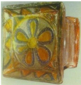
Рисунок 2. Каробчатый изразец

лennyй, охристый и коричневый цвета. Наиболее ранние узоры коробчатых изразцов на лицевой стороне имели отпечатки в виде рельефов геометрического характера: квадраты с диагональными полосами, четыре симметричных квадрата, круги в квадратах, что подтверждают находки из Лидского замка, датируемые XVI веком. С течением времени орнаменты декора становятся все более разнообразными, появляются объединенные композиции, состоящие из геометрических и растительных элементов, например, в центре цветок, по периметру геометрический орнамент, что видно по находкам: цветок – Брагинский замок (рисунок 2), букет в вазе – Мир 1583 год (рисунок 3) [1].