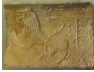
Рисунок 4. Изразец XVI век: а – из Новогрудка; б – из Кричева