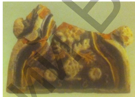
Рисунок 3. Изразец г.Мир XVI века из Брагинского замка. Середина XVI века.

В конце XVI века появляются сюжетные изображения: геральдические, «портретные», мифологические, фантастические с изображениями людей и животных.