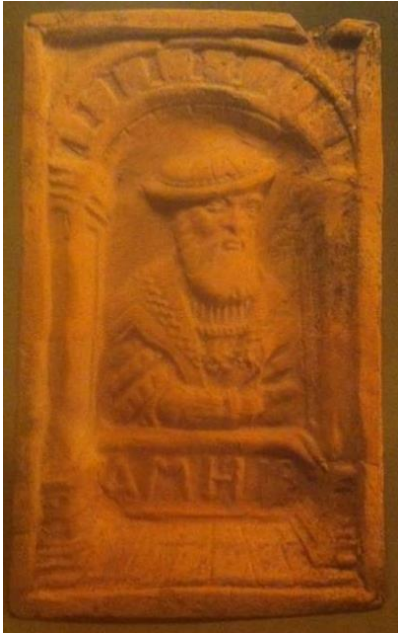
Рисунок 5. Изразец XVI века из Заславского замка

В изображении людей использовались несложные архитектурные детали в виде арки и двух колонн, снизу надпись, которая возможно указывала на конкретную особу. При этом рельеф выполнялся достаточно профессионально и технологически грамотно, он удачно вписывался в прямоугольник. Изображения человека представлялись в парадных костюмах и головных уборах, с выразительно проработанными деталями, исполнение которых требовало высокого мастерства, глубоких знаний при изготовлении форм (рисунок 5).