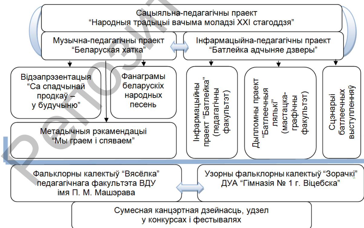
Мал. 1. Структура рэсурснага забеспячэння сацыяльна-педагогічнага праекта “Народныя традыцыі вачыма моладзі XXI стагоддзя”

Разгледзім некаторыя асаблівасці праектаў “Беларуская хатка” і “Батлейка адчыняе дзверы”.