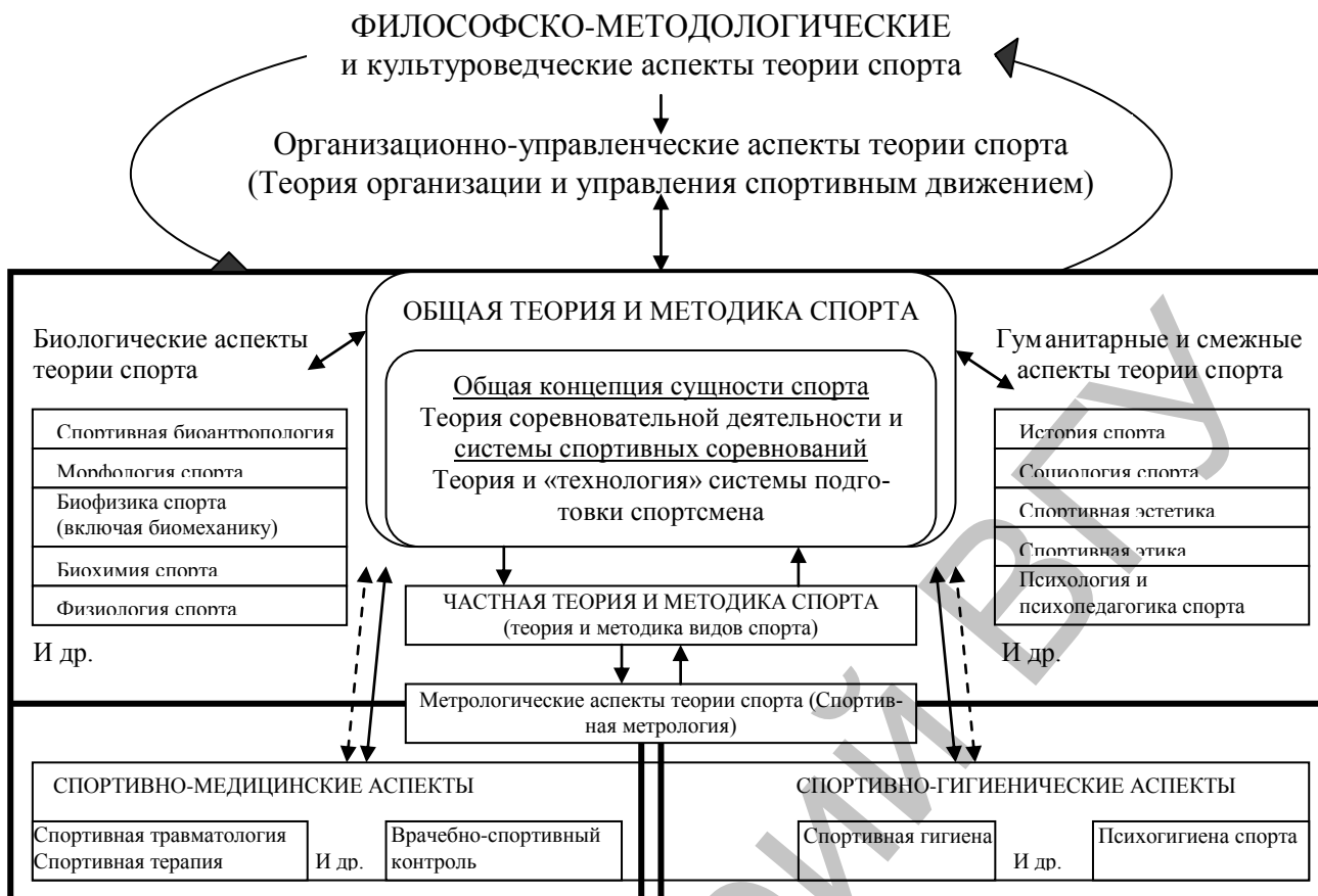
Схема (1) соотношений общей теории спорта, частнопредметных теоретико-методических дисциплин по видам спорта и смежных отраслей гуманитарного и естественнонаучного знания