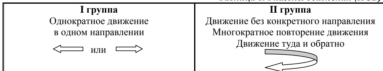
Таблица 1. Глаголы движения (НСВ)

бежать – бегать, лететь – летать, плыть – плавать