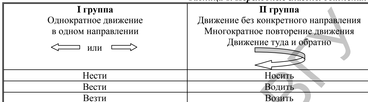
Таблица 2. Переходные глаголы