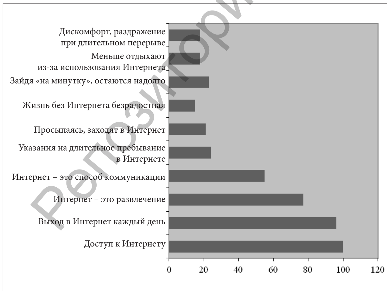
Рисунок 1 – Наиболее выраженные симптомы у подростков с интернет-зависимым поведением.

Таким образом, это обуславливает потребность в проведении дополнительных исследований по вопросам интернет-зависимого поведения подростков. Целью нашей работы явилось выявление взаимосвязи между степенью интернет-зависимого поведения подростков и их характерологических особенностей.