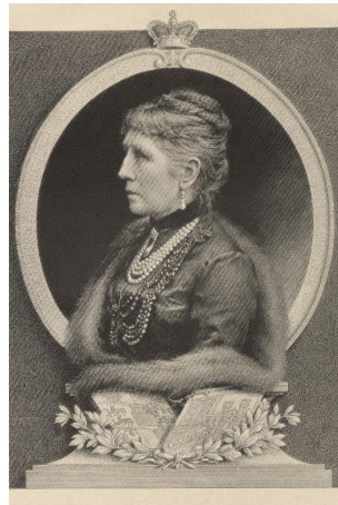
Рис. 2. И. И. Богданович. Портрет кн. Марии Гогенлоэ-Шиллингсфюрст, ур. кн. Витгенштейн. Литография с гравюры.