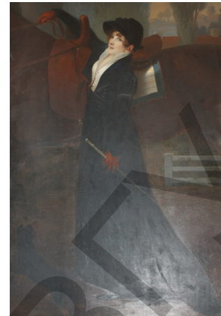
Рис. 3. И. И. Богданович. Портрет кн. Теофили Радзивилл, ур. Моравской. Копия с картины кисти неизвестного художника. Коллекция дворца Шиллингсфюрст

время входила в обмундирование российских драгун и кирасир, а также была элементом парадной формы одежды.