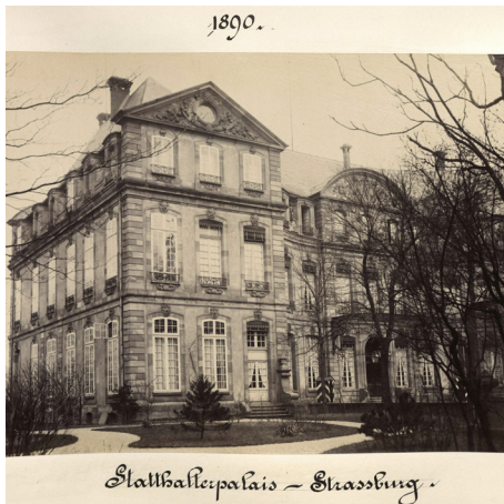
Рис. 1. Дворец наместника Эльзас-Лотарингии кн. Хлодвига Гогенлоэ.