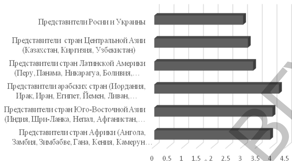
Рисунок 3 – Индекс социальной дистанции по отношению к представителям разных стран.

Все слушатели находятся в пределах толерантного отношения к представителям других национальностей (рис. 3). Более открыты учащиеся для контактов с представителями стран-соседей (Украина, Россия) ( I \approx 3,02 ). Самая большая дистанция установлена с представителями арабских стран ( I \approx 4,24 ).