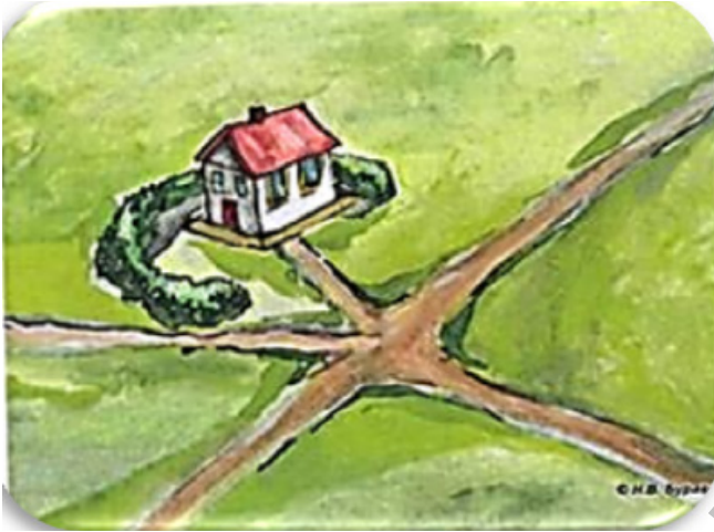
Рисунок 1 – Пример.