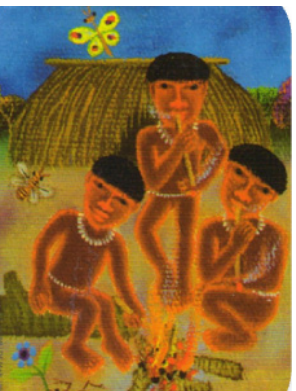
Рисунок 2 – Пример совместной истории.