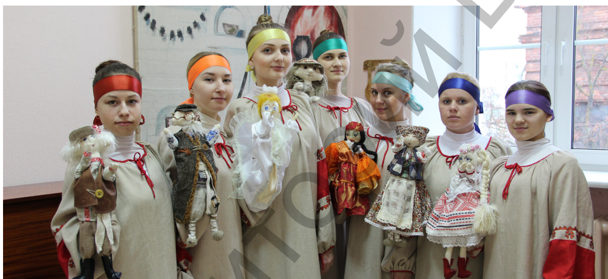
Фальклорны калектыў “Вясёлка”.

Малюнак 2 – Структура сацыяльна-педагогічнай дзейнасці ўзорнага фальклорнага калектыву “Зорачкі”.