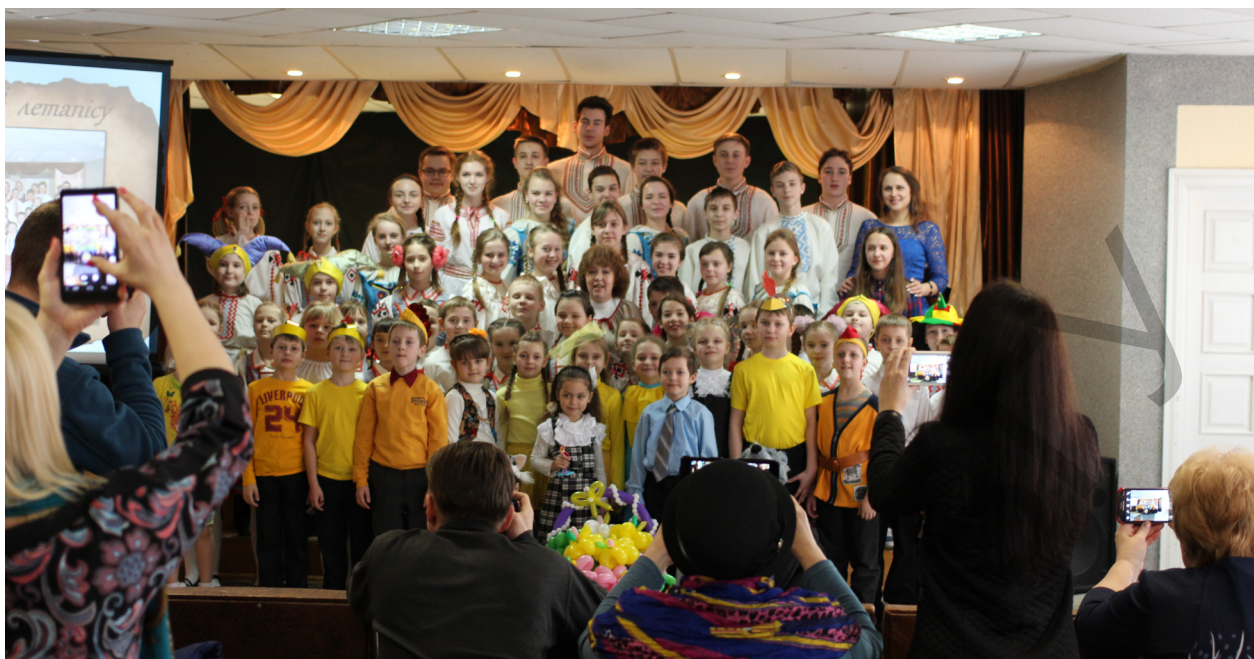
Узорны фальклорны калектыў “Зорачкі”.