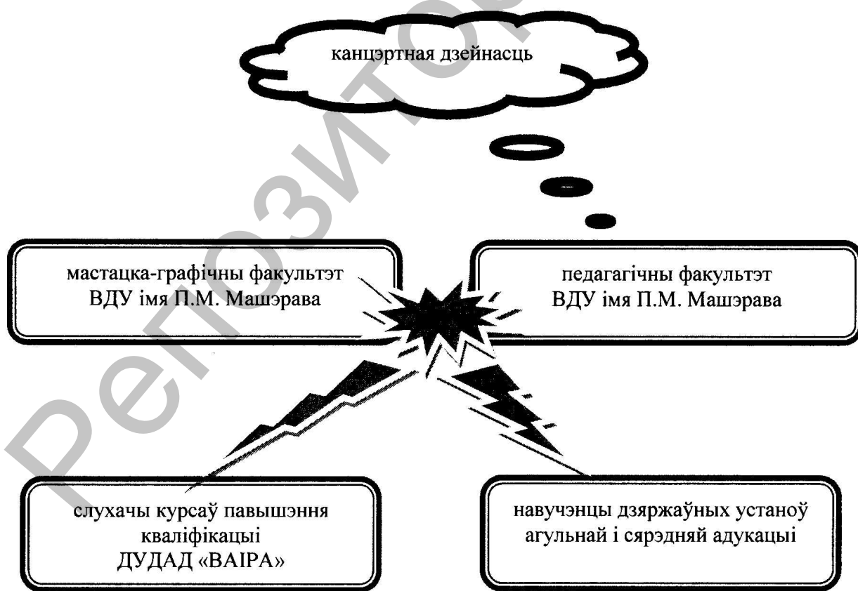
Малюнак 1 – Структура сацыяльна-педагагічнага праекта “Народныя традыцыі вачыма моладзі XXI стагоддзя”.

Фальклорны спектакль як асноўная форма дзейнасці калектыву “Зорачкі” аб’ядноўвае песенны, тэатральны і агітацыйна-мастацкія накірункі. А пастановачны матэрыял – п’еса – створаны з улікам магчымасцей, здольнасцей і запатрабаванняў удзельнікаў калектыву, а таксама ўзроўню іх арганізаванасці. Працэс падрыхтоўкі спектакля фальклорнага калектыву прадстаўлены ў табл. 1.