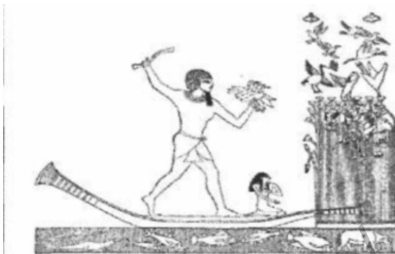
Рис. 2. Египтянин на охоте. Рисунок с древнегреческой стенной росписи.

нии композиции пейзажа многообразные композиционные схемы выбора точки зрения, высоты линии горизонта и др. Составленные известными художниками, отраженные в их эскизных набросках и зарисовках, эти схемы используются в области художественной педагогики как инструмент анализа композиции, объект изучения, средство освоения соответствующих умений. Они служат также основным средством формирования умений создания художественного образа, поэтому широко применяются при выполнении заданий творческого характера, помогая освоению языка изобразительного искусства.