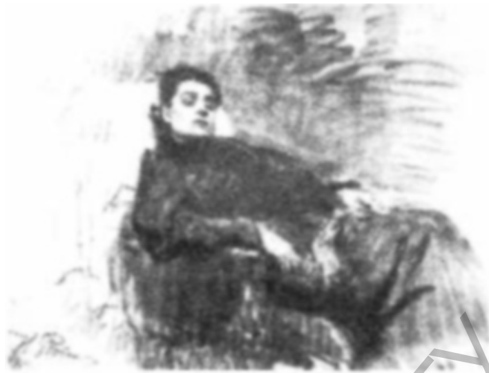
Рис. 3. И. Репин. Портрет актрисы Дуже.

освоения учащимися в практической изобразительной деятельности. В практике преподавания предмета устные разъяснения учителя относительно смысла изучаемого произведения или изображения, описание и анализ его изобразительных и выразительных средств — один из основных путей его освоения.