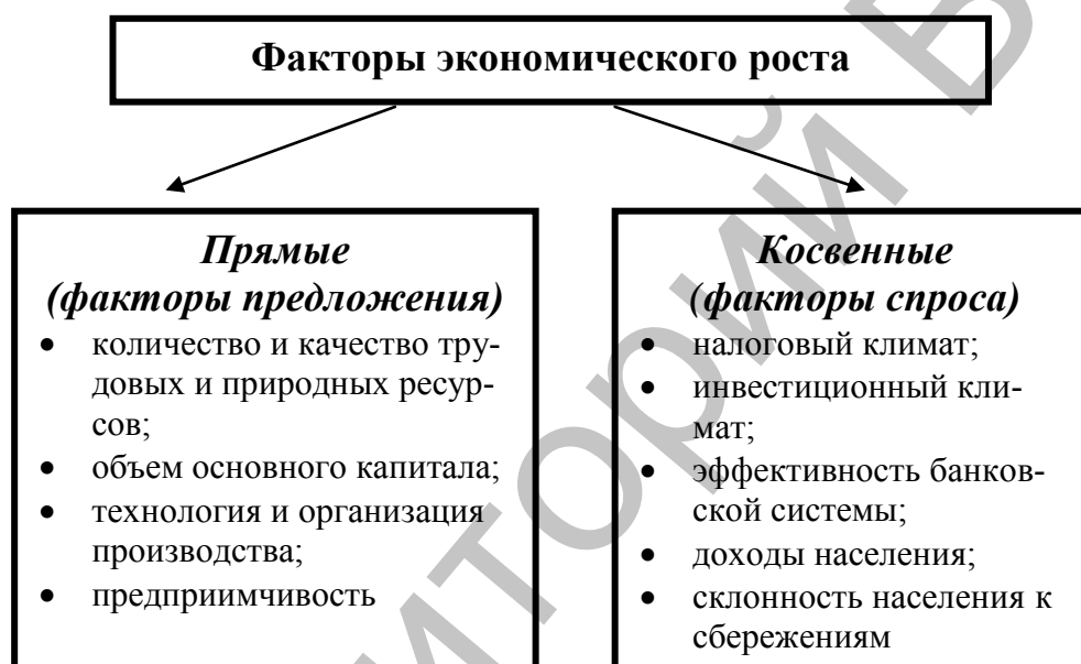
Рисунок 5.1 – Прямые и косвенные факторы экономического роста

Экономический рост определяется множеством факторов. Под факторами экономического роста принято понимать явления, обстоятельства и процессы, способные определять темп и масштабы долгосрочного увеличения объема национального производства. Выделяют прямые и косвенные факторы экономического роста (рисунок 5.1).