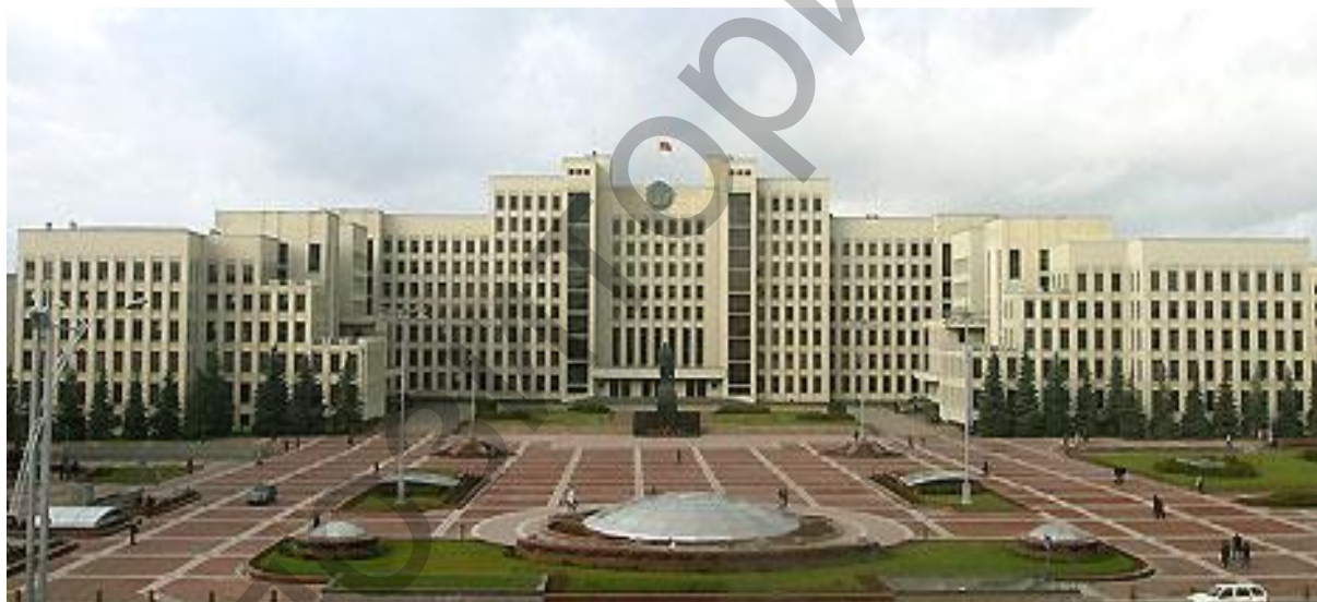
Рисунок 2.5. Дом Правительства. Минск

Согласно ст. 1 Закона Республики Беларусь «О Совете Министров Республики Беларусь» от 23 июля 2008 г., Совет Министров Республики Беларусь – Правительство Республики Беларусь является коллегиальным центральным органом государственного управления Республики Беларусь, осуществляющим в соответствии с Конституцией Республики Беларусь исполнительную власть в Республике Беларусь и руководство системой подчиненных ему республиканских органов государственного управления и иных государственных организаций, а также местных исполнительных и распорядительных органов.