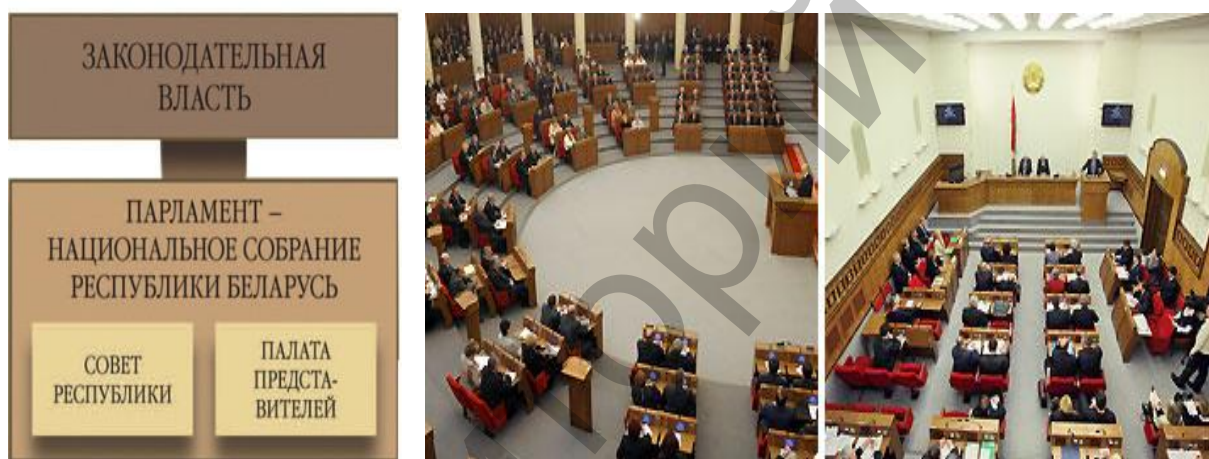
Рисунок 2.4. Парламент Беларуси – Национальное собрание Республики Беларусь

Состав Палаты представителей – 110 депутатов. Избрание депутатов Палаты представителей осуществляется в соответствии с законом на основе всеобщего, свободного, равного, прямого избирательного права при тайном голосовании. Депутаты должны быть гражданами Беларуси в возрасте от 21 года. Они могут быть членами правительства, но не могут в то же время работать в Совете Республики.