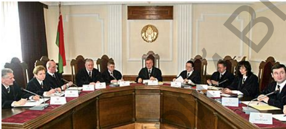
Рисунок 2.8. Заседание Конституционного суда Республики Беларусь

Особое место в системе органов государственной власти Республики Беларусь занимают органы государственного надзора и контроля .