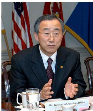
Рисунок 13.1. Пан Ги Мун – Генеральный Секретарь ООН

Генеральный секретарь предпринимает усилия по урегулированию конфликтов между государствами и имеет право доводить до Совета Безопасности сведения о спорах, угрожающих, по его мнению, международному миру и безопасности.