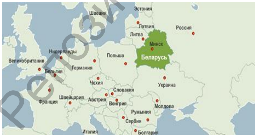
Рисунок 2.1. Беларусь на карте Европы

Республика Беларусь располагается в центре Европы (рис. 2.1). Территория страны – 207,6 тыс. кв. км. Численность населения – 9,7 млн человек. Столицей страны является г. Минск, с численностью населения 1,8 млн человек.