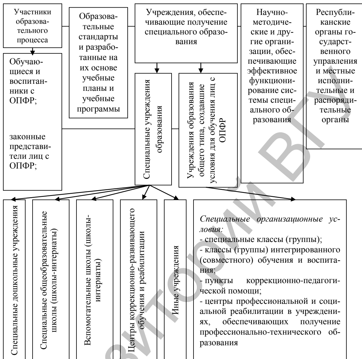
Рисунок 1. Система специального образования Республики Беларусь

Управление специальным образованием лиц с ограниченными возможностями осуществляет следующие функции :