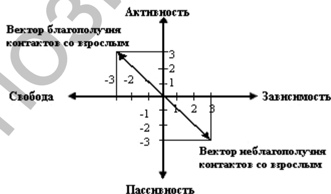
Рисунок 3 – Вектор влияния контактов со взрослым.

В нашем исследовании человеческий фактор представлен системой взаимодействия взрослых с ребенком, следовательно, означенный вектор в модели выступает как вектор благополучия-неблагополучия контактов со взрослым (рисунок 3).