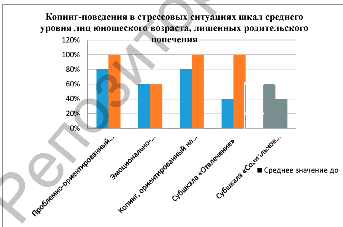
Рисунок 2 – Результаты исследования копинг-поведения в стрессовых ситуациях шкал среднего уровня лиц юношеского возраста, лишенных родительского попечения, до и после проведения коррекционной программы (за 100% принят средний уровень выраженности переменной).