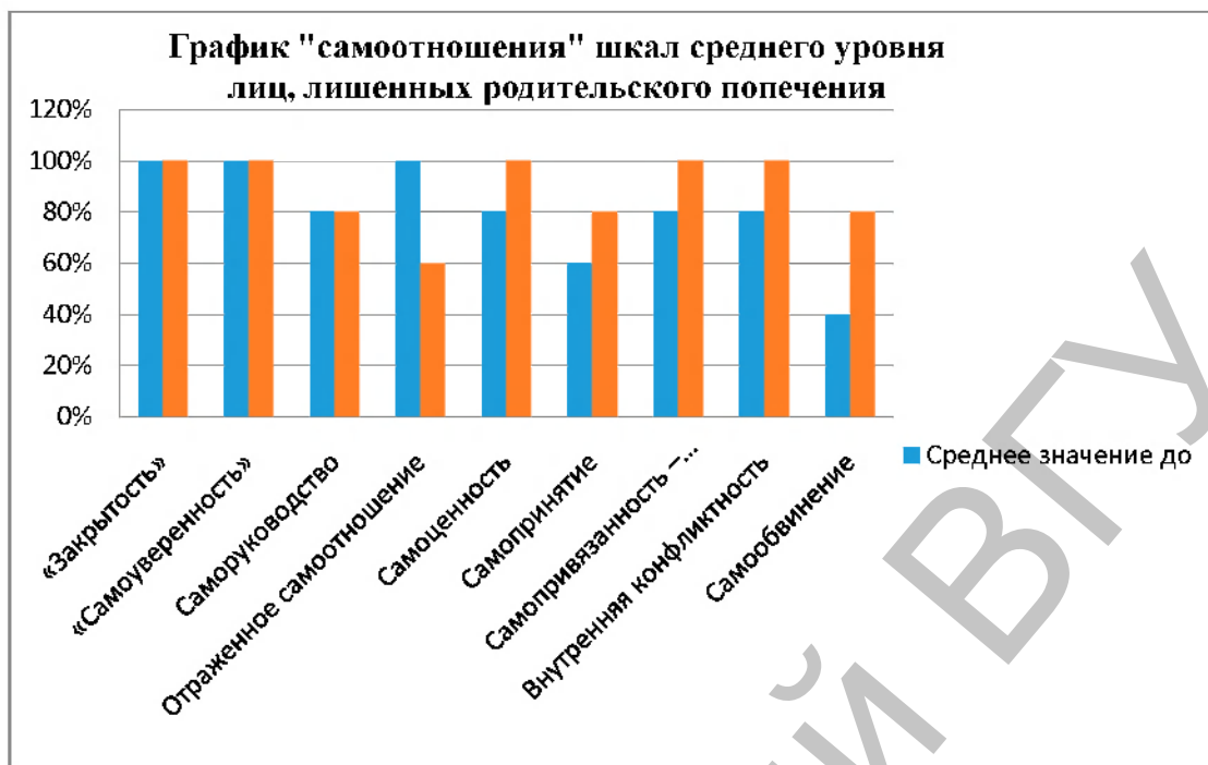
Рисунок 1 – Результаты исследования самоотношения у лиц, лишенных родительского попечения, до и после проведения коррекционной программы (за 100% принят средний уровень выраженности переменной)