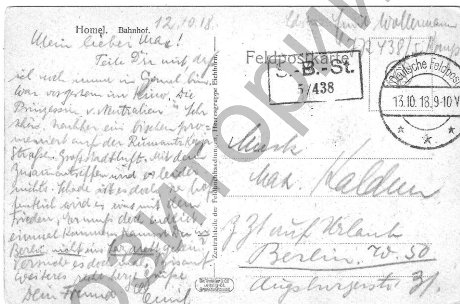
Фото 2 – Письмо Э. Воллерманна (коллекция автора).